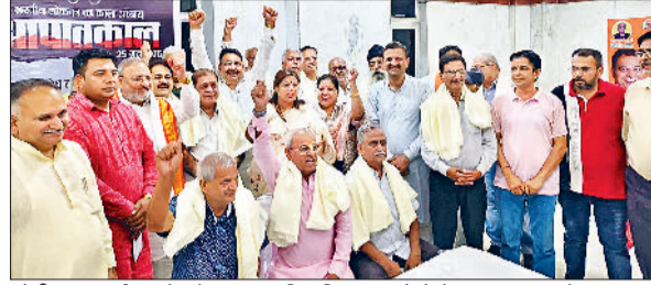
सोनीपत। कार्यक्रम के दौरान सम्मानित किए गए लोगों के साथ भाजपा नेतागण।