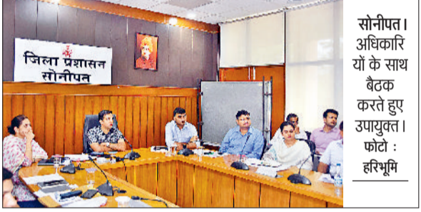
सोनीपत। अधिकारियों के साथ बैठक करते हुए उपायुक्त।

■ बरसात के समय किसी भी सड़क पर खड़ा न हो पानी, अन्यथा संबंधित एजेंसी के खिलाफ होगी कार्रवाई