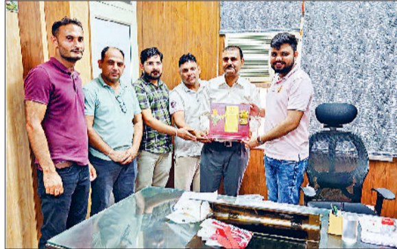
सोनीपत। उपमंडल अभियंता को सम्मानित करते स्थानीय निवासी।