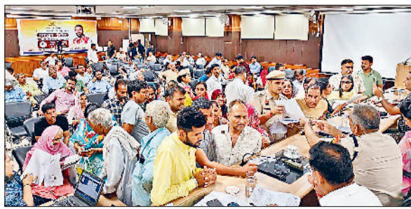
सोनीपत। समाधान शिविर में अधिकारियों के समक्ष अपनी शिकायतें रखते हुए लोग।

सरकार के निर्देशों के तहत जिले में समाधान शिविर का आयोजन किया जा रहा है। बुधवार को जिले में जिला स्तरीय और उपमंडल स्तरीय समाधान शिविर का आयोजन किया गया। जिला स्तर पर लघु सचिवालय में समाधान शिविर लगाया गया, जोकि उपायुक्त की अध्यक्षता में आयोजित किया गया। इस दौरान कुल 78 शिकायतें सामने