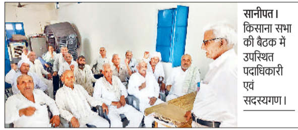
सोनीपत। किसान सभा की बैठक में उपस्थित पदाधिकारी एवं सदस्यगण।

संयुक्त किसान मोर्चा का अहम घटक किसान संगठन अखिल भारतीय किसान सभा सोनीपत में किसानों ने उपायुक्त कार्यालय का घेराव कर मुख्यमंत्री के नाम ज्ञापन सौपा। ज्ञापन नायब तहसीलदार को दिया गया, जिसमें मांग की गई कि केंद्र सरकार एस्पी की कानूनी गारंटी दे, बिजली बिल 2022 को तुरंत प्रभाव से रद्द करें, जन सेवाओं का निजीकरण बंद किया जाए, गरीब किसान मजदूर के तमाम प्रकार के कर्ज माफ किए जाएं, 12 किलोमीटर के दायरे में टोल की परिधि