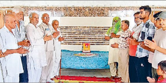
गोहाना। छत्रपति साहूजी के चित्र पर पुष्प अर्पित कर नमन करते नागरिक।