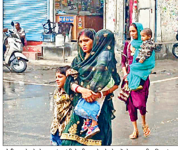
सोनीपत। रेलवे रोड पर बूंदबांदी के बीच बच्चे को गोद में लेकर जाती महिलाएं। गर्मी और हवाएं चलने लगीं। जिसकी वजह से मौसम में फिर बदलाव हो गया। दूसरी ओर मौसम विशेषज्ञों की मानें तो प्री मानसूनी हवाओं के

तक फिर से बारिश के संकेत बताए गए हैं। दिल्ली-एनसीआर क्षेत्र में बुधवार सुबह से आसमान में बादल छाए रहे, लेकिन हवा नहीं चलने से लोगों को घुटन भरी गर्मी का सामना करना पड़ा। हालांकि सुबह कुछ क्षेत्रों में हुई बूंदबांदी से राहत मिली, लेकिन यह ज्यादा देर बरकरार नहीं रह सकी। कुछ ही देर में धूप खिल आई और लोगों को फिर उमस भरी गर्मी झेलनी पड़ी। वातावरण में उमस की मात्रा 80 फीसदी तक पहुंच गई। जिले का अधिकतम तापमान 35 डिग्री सेल्सियस और न्यूनतम तापमान 29.7 डिग्री सेल्सियस दर्ज किया गया। जबकि एक दिन पहले अधिकतम तापमान 37.4 डिग्री और न्यूनतम तापमान 27 डिग्री दर्ज किया गया था। दिन भर 10 किलोमीटर प्रतिघंटा की रफ्तार से हवाएं चलीं।