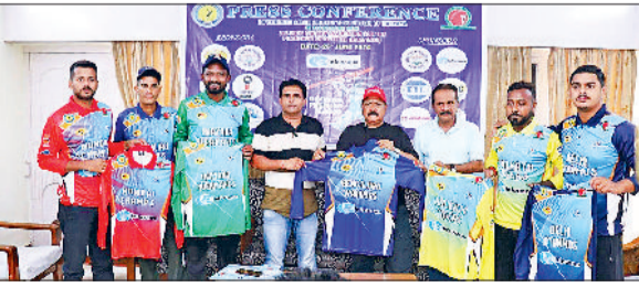
पत्रकार वार्ता के दौरान विभिन्न टीमों की टी शर्ट दिखाते आयोजक।

सोनीपत में दिव्यांग प्रीमियर लीग का आयोजन किया जा रहा है। आइवीएल की तर्ज पर आयोजित किए जाने वाले टूर्नामेंट में देशभर से 100 दिव्यांग खिलाड़ी अपनी प्रतिभा दिखाएंगे। प्रतियोगिता का आयोजन माधव क्रिकेट मैदान में किया जाएगा। वहीं प्रतियोगिता का आयोजन ऑल इंडिया क्रिकेट एसोसिएशन फॉर फिजिकली चैलेंज्ड के सहयोग से डिफरेंसली एबलड क्रिकेट एसो ऑफ हरियाणा के तत्वावधान में होगा। प्रतियोगिता 27 से 30 जून तक चलेगी।